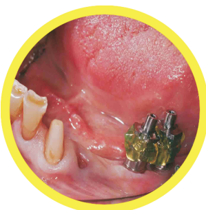
Εξαιρετικά ακριβής πρόσθια κατασκευή μέσα στο στόμα