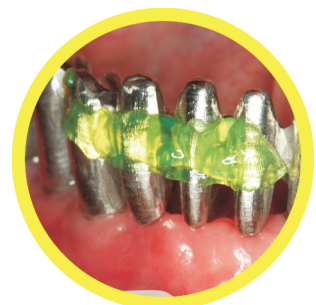
Νάρθηκοποίηση μεταλλικής κατασκευής μέσα στο στόμα