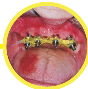
Νάρθηκοποίηση αξόνων μεταφοράς εμφυτευμάτων πριν την αποτύπωση