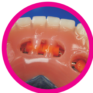
Συγκόλληση συνδέσμων σε επένθετες