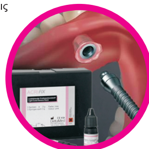
Ειδικές, λεπτομερείς προσθήκες