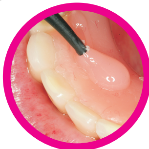
Κλείσιμο οπών κοχλίωσης σε επιεμφυτευματικές