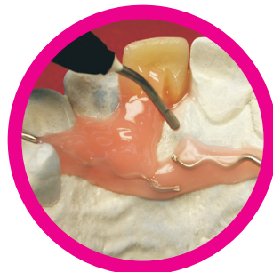
Τοπικές μικρο- αποκαταστάσεις