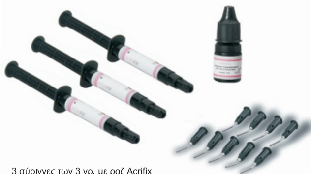
3 σύριγγες των 3 γρ. με ροζ Acrifix 1 bonder των 5 ml 12 στόμια